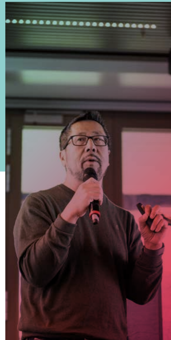
~~~~~ Ana A. (PUB)

Social media has overtaken traditional TV as the primary news source for younger audiences. In the UK, 47% of individuals aged 18-24 get their news from social media, while in Belgium, 60% of individuals under 30 rely on social media for daily news, up from 40% three years ago. This shift, however, has introduced challenges around misinformation, as the ability to manipulate content online makes it harder to distinguish fact from fiction.